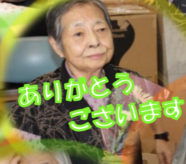
ありがとうございます