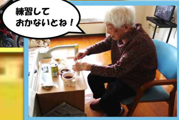
練習しておかないとね!