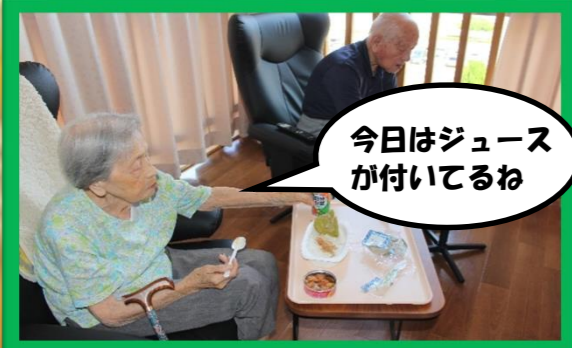
今日はジュースが付いてるね

年に1度の停電訓練にご協力いただきありがとうございました 備蓄食のやきとりの缶詰が意外と美味しいと笑われていました